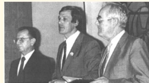
eine Konferenz mit 3 Bischöfen: Armin Härtel, Rüdiger Minor und Franz Schäfer (v.l.n.r.)

Eine ganz besondere Konferenz mit großen Entscheidungen war die Konferenz 1986, die zugleich auch als Zentralkonfe- renz der evangelisch–metho- distischen Kirche in der DDR fungierte, denn mit Bischof Rüdiger Minor wurde ein